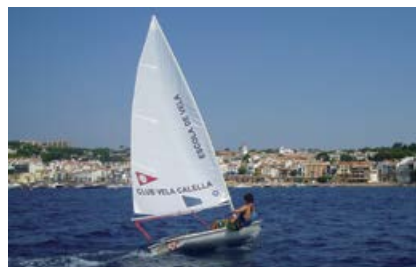
Perfeccionament Làser Horari: de 12 a 14h