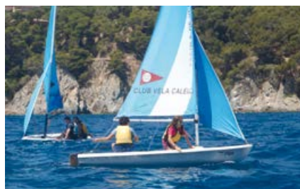
Avançat Làser Pico Horari: de 9.30 a 11.30h ó d'11.30 a 13.30h