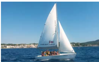
Iniciació I i II Gamba Horari: de 9.30 a 11.30h ó d'11.30 a 13.30h